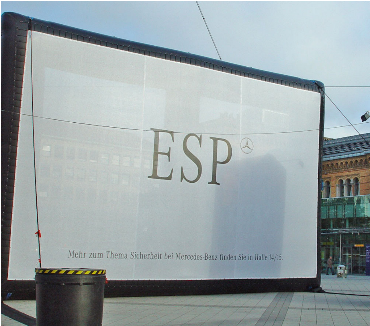
Aufblasbares aus PVC-Gewebe bestehendes 3D Objekt zur Montage von Riesenposter